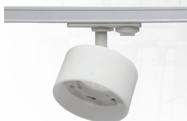
PTR 30 GU53 WH

Адаптер для подключения к однофазному шинному проводу является конструктивным элементом прожектора.