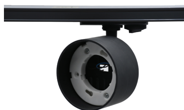
PTR 30 GU53 BL