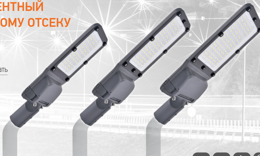
PSL 04-3 100w