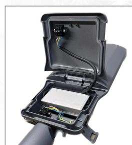
Светильник легко обслуживать