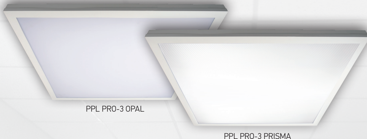
PPL PRO-3 OPAL