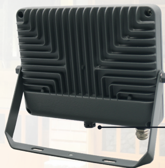
Клапан выравнивания давления