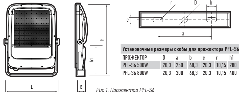
Рис. 1. Прожектор PFL-S6